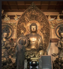
来迎阿弥陀三尊像とお七地蔵