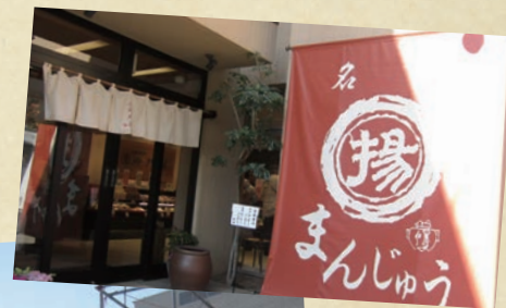
目黒土産の定番 揚げまんじゅうの 御門屋本店