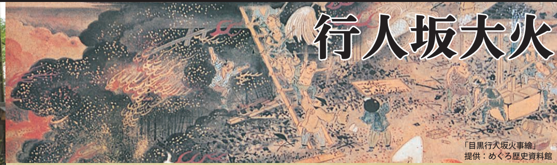
「目黒行人坂火事繪」 提供：めぐる歴史資料館