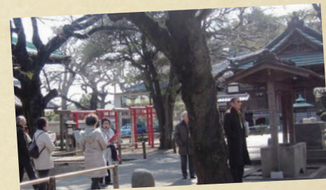
まち歩きでは、祐天寺の境内にも立ち寄りしました

目黒消防署の後に おじゃまいたしました御門屋 さんは、今や「揚げまんじゅう」で有名ですが、 元々は「お煎餅」の販売から始まりました。お 煎餅でも「揚げる」にこだわり、そのヒントから 「揚げまんじゅう」が誕生したそうです。目 黒のお土産にいかがでしょうか?