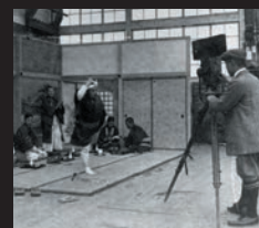
吉沢商店目黒撮影所 ガラスステージでの撮影風景