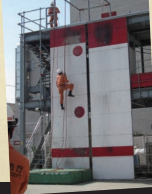
日頃の訓練の賜物! レスキュー隊による 消防訓練