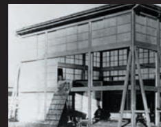
建設中の吉沢商店目黒撮影所 ガラスステージ外観