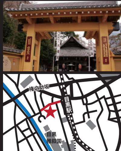
【行人坂】・【大円寺】目黒区下目黒1-8-5/JR・東急目黒線・東京メトロ・都営地下鉄「目黒駅」3分

歴史を秘め、行人坂の途中にひっそりと佇む寺。松林山大円寺は、寺の縁起によれば江戸初期の元和年間(1615~23)頃に、奥州湯殿山の修験僧大海法印が、大日如来を本尊とする修験道場を開いたのが始まりといえます。急坂の途中にある境内には、釈迦堂、本堂、阿弥陀堂が配され、「清涼寺式釈迦如来像(重文指定)」「開運招福大黒天(山の手七福神)」「十一面観音像」「来迎阿弥陀三尊像」などを安置しています。また最も目を引くのは左手の崖一面に並ぶ石の「五百羅漢像」。数奇な歴史やいわれを秘めた江戸の風情残す寺(史跡)です。